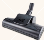
カーペット用ターボノズルW