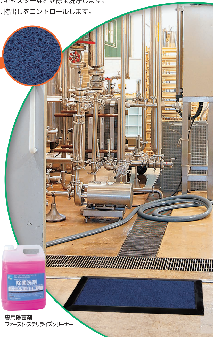
専用除菌剤 ファースト・ステライズクリーナー